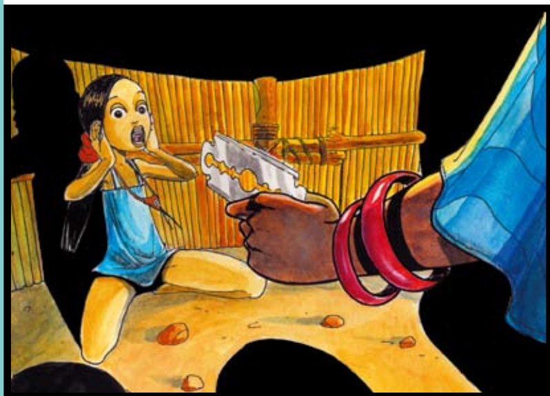
© Sidy N'Diaye - extrait de « Diariatou face à la tradition »